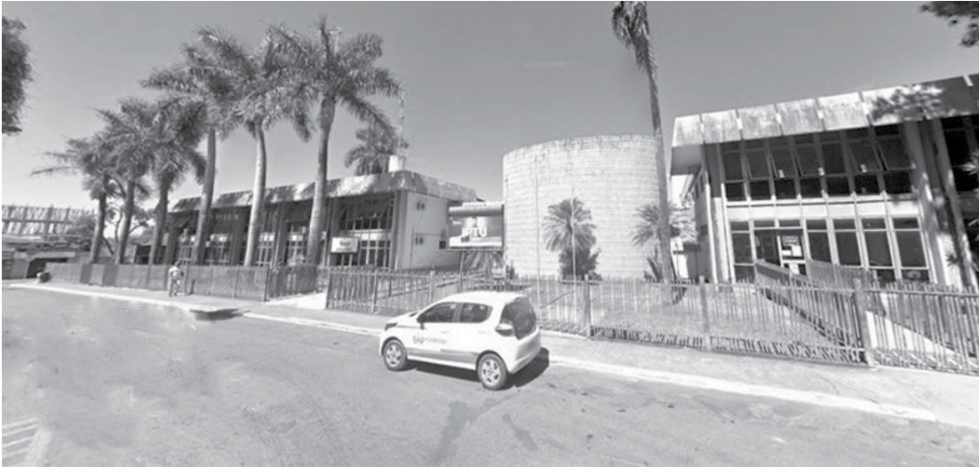
Prefeitura de Formosa. Maior colégio eleitoral da região