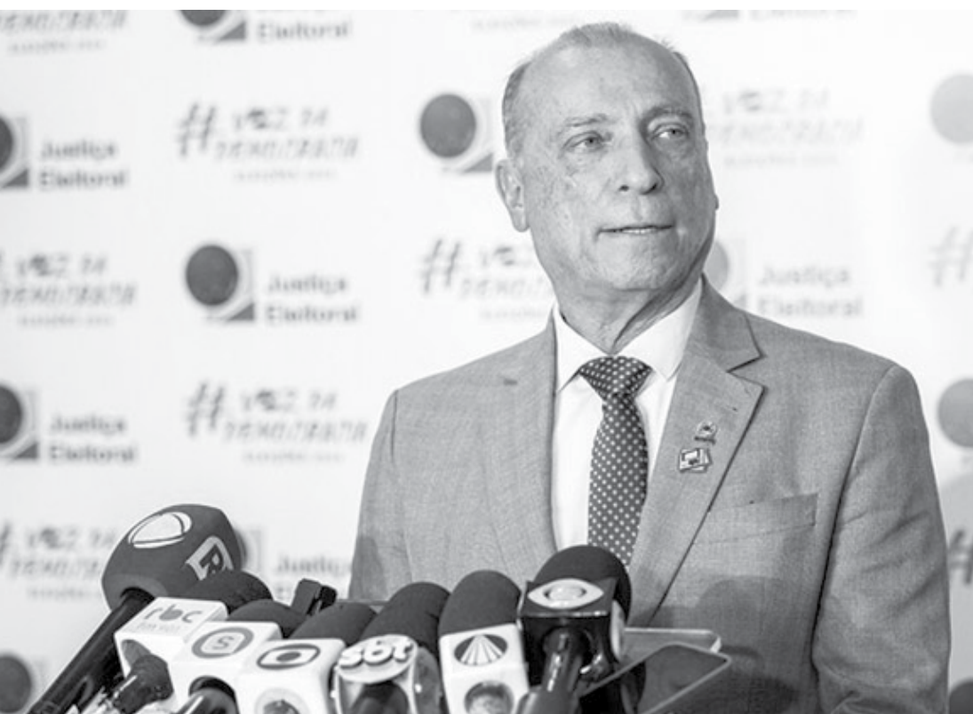
Desembargador, presidente do TRE-GO

O Tribunal Regional Eleitoral de Goiás/TRE-GO, lançou em agosto desse ano, uma ferramenta de checagem para auxiliar no combate às fake news e deepfakes. Desenvolvida em parceria com o Instituto de Informática da Universidade Federal de Goiás/UFG, a GuaIA, analisa