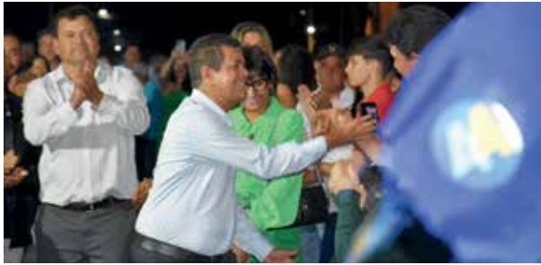
“Tuta”, bem avaliado e Manoel. Continuidade

A disputa ficará entre três candidatos dos partidos União Brasil/UB, Partido Liberal/PL e Democracia Cristã/DC