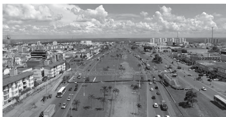
Valparaíso. Cidade que mais cresce na região

12 municípios goianos vizinhos Águas Lindas de Goiás, Formosa, Alexânia, Cidade Ocidental, Cocalzinho de Goiás, Cristalina, Luziânia, Novo Gama, Padre Bernardo, Planaltina de Goiás, Santo Antônio do Descoberto e Valparaíso de Goiás. O levantamento do IPEDF analisou ainda apenas esses vizinhos e o crescimento anual deles foi de 2,22%. Ou seja, eles estão crescendo mais que Brasília. Um exemplo desses vizinhos que se destacam em crescimento é Valparaíso de Goiás, que