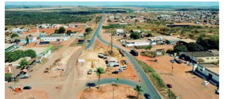
Obras estão emperradas há anos nas entradas da maior cidade da região

templam a duplicação de 12 quilômetros da rodovia, com conclusão prevista para o primeiro semestre de 2026. A construção dos viadutos teve início em 2020 e foi parali-