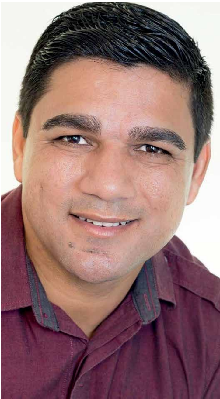
Prefeito tem situação tranquila e segue trabalhando

O município é o único da região com um só candidato a prefeito