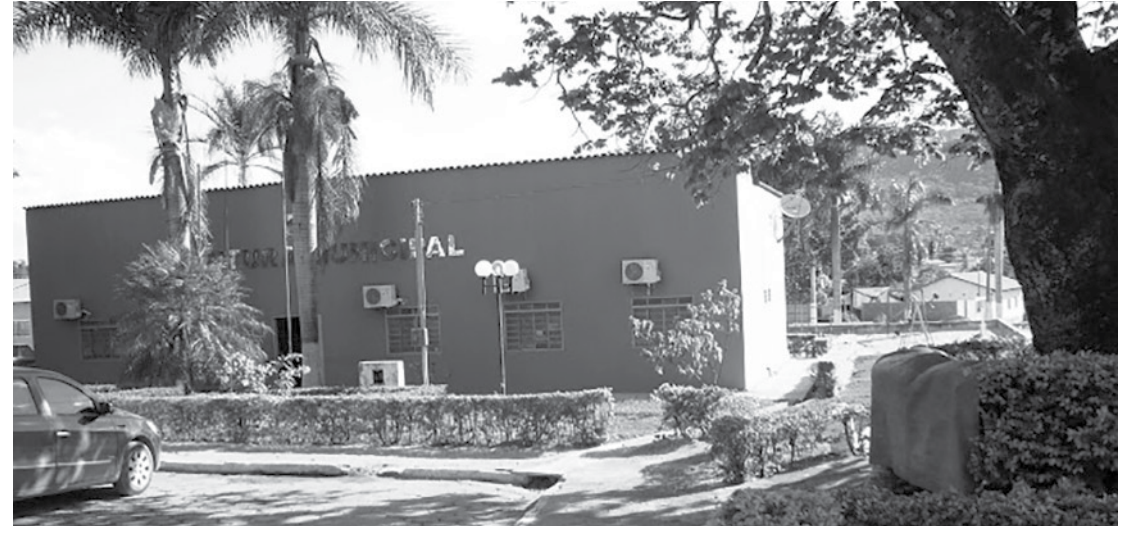
Prefeitura de Nova Roma. Menor colégio eleitoral da região

Nas eleições de 2024 a região do Nordeste Goiano e parte do Entorno Norte do Distrito Federal, soma uma quantia considerável de votos. Nos 25 municípios nessas regiões, 309.462 eleitores estão aptos a votar.