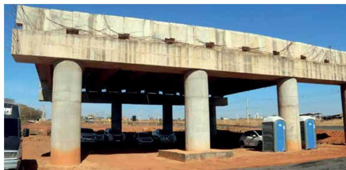
Um dos viadutos em Formosa abandonado

No dia 13 de agosto, uma nova assinatura de ordem de serviço, dessa vez feita pelo ministro dos Transportes, Renan Filho, retoma as obras do complexo de viadutos na BR-020, no trecho urbano de Formosa. São quatro interseções com dois viadutos em cada, além da implantação de vias marginais. As obras paralisadas há cerca