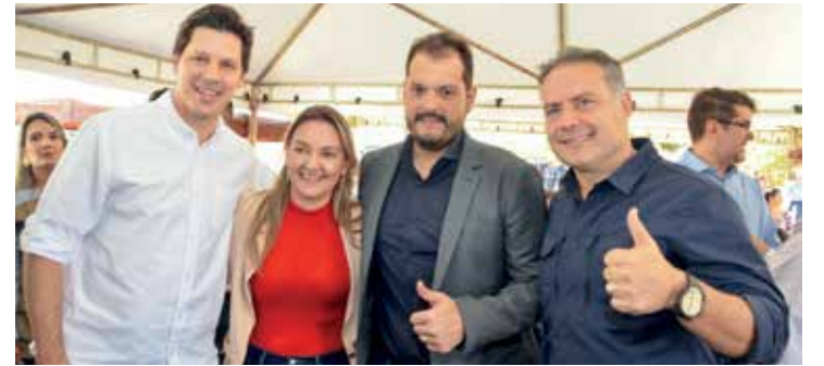
Vice-governador, 1ª dama, prefeito e ministro. Retomada

viços que precisam ser concluídos, estão a adequação de capacidade, implantação de melhorias e entre outros a eliminação de pontos críticos na travessia urbana. Em dezembro de 2018, foi assinado o contrato para as obras do trecho, que seguiram de forma lenta. Em julho de 2022 o consórcio de empresas, que já vinha com morosidade, abandonou o projeto, resultando na paralisação e abandono completo das obras. O DNIT então iniciou a rescisão do contrato, publicada em outubro de 2022. Durante esse período, foram concluídos os projetos de engenharia e atualizado o orçamento. Em junho de 2024, foi aberto um novo edital para a licitação e contratação de uma nova empresa, explicou o ministro. Os investimentos do Governo Federal con-