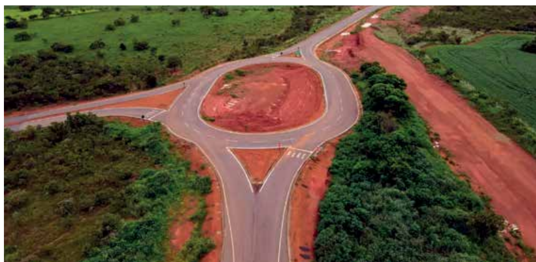
Trevo em Cabeceiras de acesso à divisa com MG. Pronto

A ligação da rodovia GO-591 com a MG-188 foi concluída, permitindo que motoristas com destino a Unaí, BR-040, Belo Horizonte, Rio de Janeiro ou qualquer local do Sudeste e Sul do país, viagem sem precisar trafegar por estradas de terra. O trecho final que faltava ser asfaltado já está pavimentado e da mesma forma o trevo de acesso nas proximidades de Cabeceiras.