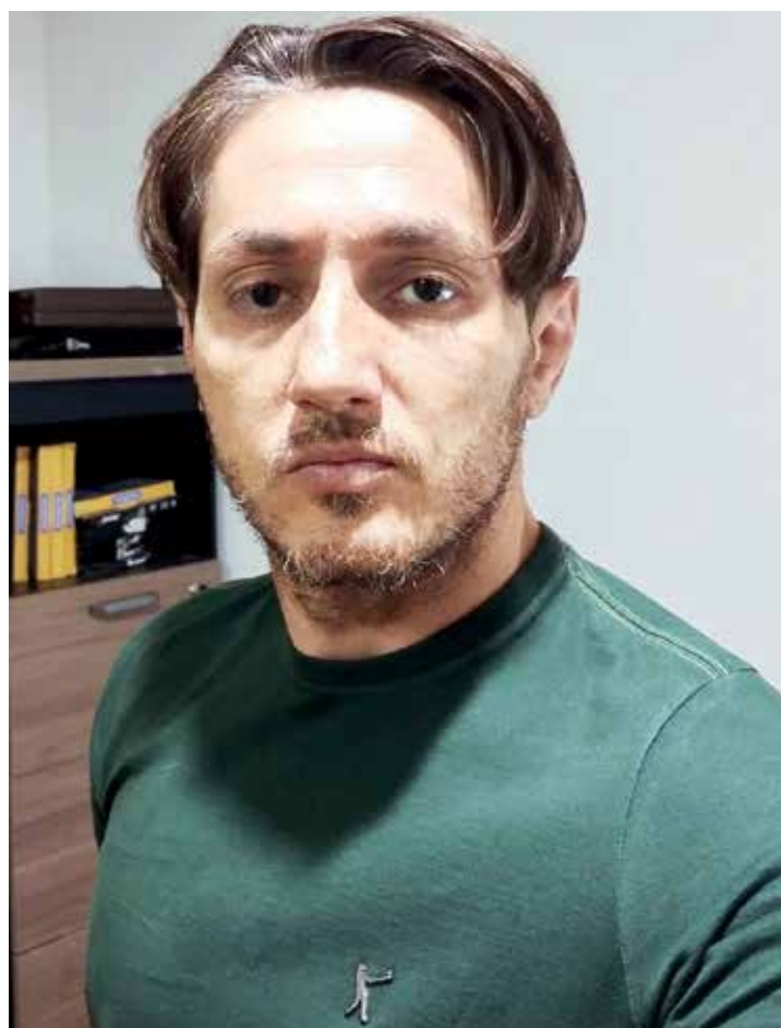
Thales. Brincadeiras e ataques que se transformaram em crimes. Sem limites

Nos vários grupos de WhatsApp, tornou-se normal a veiculação de áudios criminosos, contendo mentiras ofensivas e com claro apelo político para beneficiar ou prejudicar determinados grupos. Pessoas ligadas a emissoras de rádio, passaram todo o período de pré-campanha,