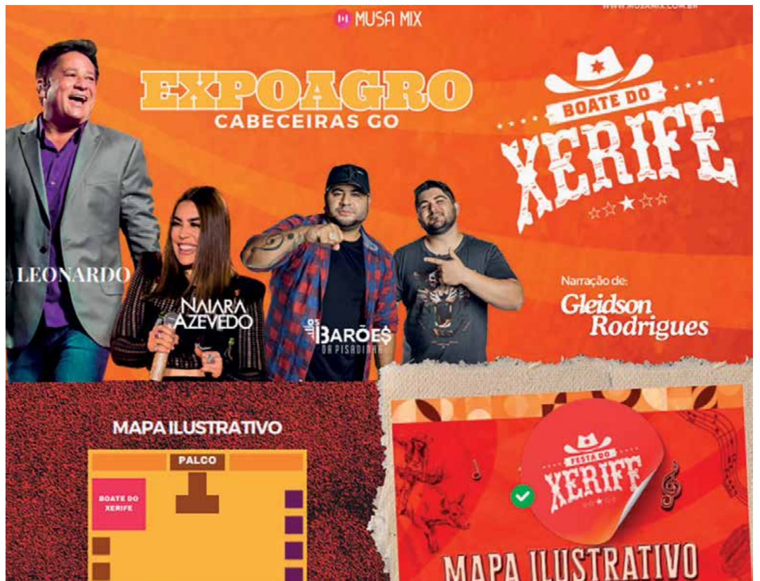
Material de trabalho da Boate do Xerife