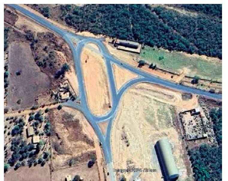
Rodovia muda aspecto e direcionamento na entrada de Cabeceiras

A ligação da rodovia GO-591 com a MG-188 foi concluída, permitindo que motoristas com destino a Unai, BR-040, Belo Horizonte, Rio de Janeiro ou qualquer local do Sudeste e Sul do país, viagem sem precisar trafegar por estradas de terra. Os quatro quilômetros restantes, que faltavam ser asfaltados já estão pavimentados e da mesma forma a obra do trevo de acesso à GO-346 nas proximidades de Cabeceiras. Por anos, os 14.790 metros de estrada de terra até a divisa com Minas Gerais eram um dos maiores problemas da região e empecilho para o desenvolvimento do município. A obra, que havia se transformado em várias promessas de campanhas eleitorais, municipais e estaduais, não saía do papel. Em 2014 o vereador Manoel Teixeira, atual vice-prefeito, junto com os demais vereadores, revelou que tanto o Estado de Goiás quanto o Governo Federal não eram responsáveis pela rodovia, e sim o município. Nesse ano, o Legislativo de Cabeceiras aprovou lei autorizando o Poder Executivo a transferir a rodovia para o Estado, com a justificativa de que a prefeitura não teria condições de