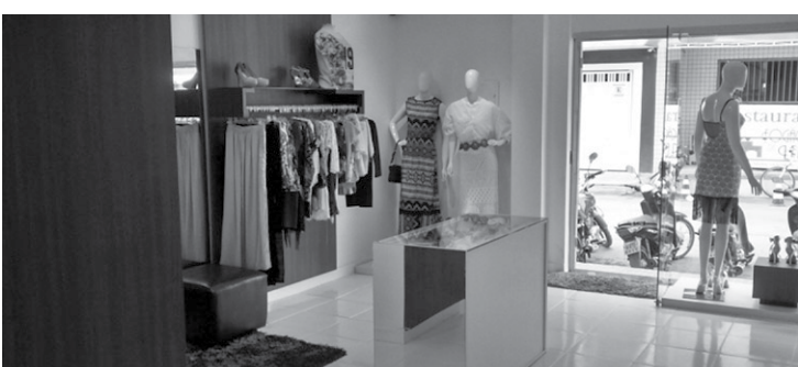
Comércio lojista. Inadimplência de clientes nesse setor

FCDL-GO traça perfil dos consumidores inadimplentes; 30% têm dívidas de até R$ 500